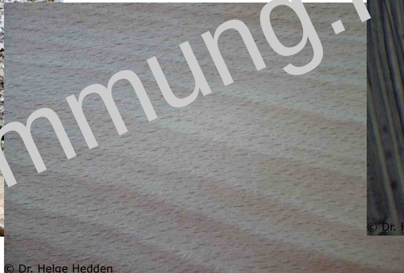
© Dr. Helge Hedden Tangentialansicht Buchenfurnier (ohne Rotkern)