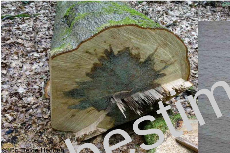
Spritzkern einer rotkernigen Rotbuche